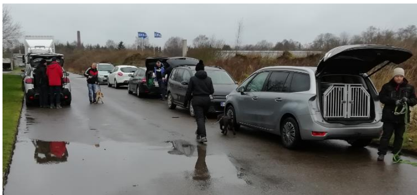
Baneforhold er pt. meget våde, så træning på vejen er løsningen.