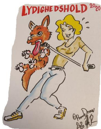
Udklip modtaget fra Signe