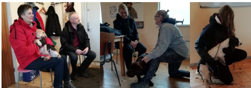
Her er der opstart i klubhuset